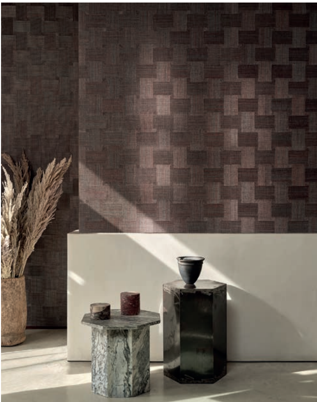
LATTICE MOSAIC | 4 Farben

Inspiziert von Berbergeweben, besteht diese handgewebte Tapete aus handgefärbten Bastgarnen, die einen wunderschön strukturierten Kontrast zu vertikalen Streifen bilden.