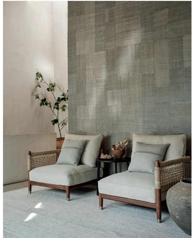
ABACÁ PATCHWORK | 6 Farben

Unregelmäßige Garne aus natürlichem Abacá kontrastieren mit einem handgesponnenen Baumwollgewebe, um ein Design mit einem ausgeprägten horizontalen Aspekt zu schaffen.