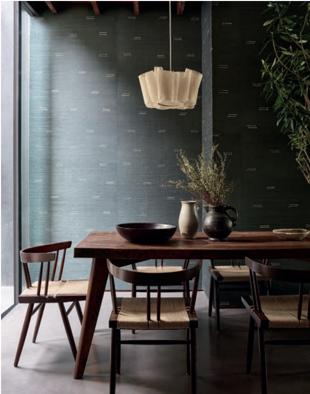
SURU | 6 Farben

Handgeschnittene Garne aus Bast verleihen dieser handgewebten Sisaloptete feine Textur und Eleganz.