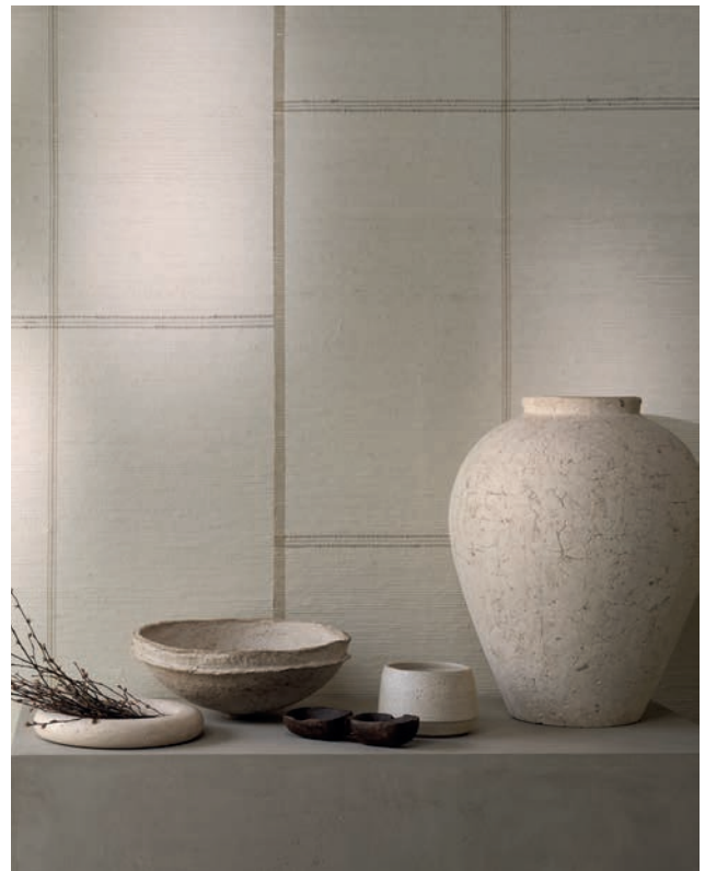
KOSHI | 4 Farben

Geschnittene Stücke aus handgewebtem Sisal nebeneinander erzeugen einen atemberaubenden Gittereffekt, der diese Mosaiktapete zu etwas ganz Besonderem macht.