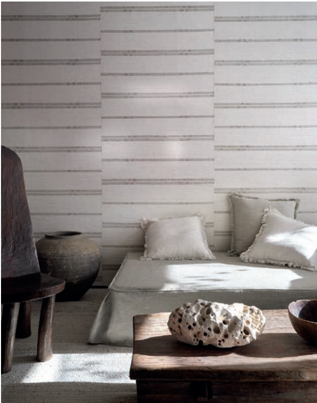
KOBE | 5 Farben

Grobe Stränge der Bananenrinde erzeugen eine bunte Textur, die durch einen Hauch von Erdtönen subtil wirkt.