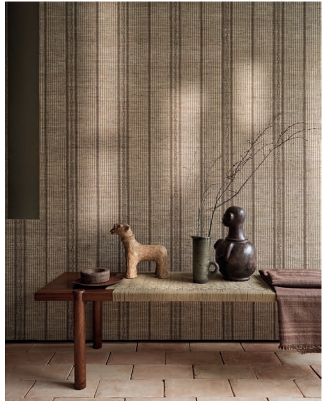
MEDINA | 3 Farben

Ein Gitterwerk aus handgewebten Wasserhyazinthen wurde mit einem dezenten Glanz auf Papier aufgezogen, wodurch ein kontrastreiches Design entsteht.