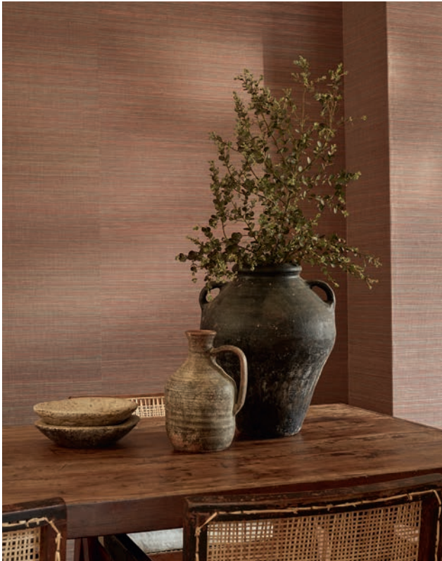
DUO ABACÁ | 6 Farben

Verschiedene Farben der Abacá-Garne kontrastieren auf subtile und zufällige Weise und erzeugen eine sanfte Bewegung in dieser schimmernden Grastapete