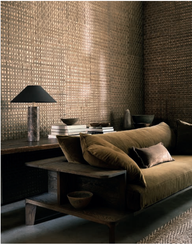
HYACINTH WEAVE | 4 Farben

Ein Gitterwerk aus handgewebten Wasserhyazinthen wurde mit einem dezenten Glanz auf Papier aufgezogen, wodurch ein kontrastreiches Design entsteht.