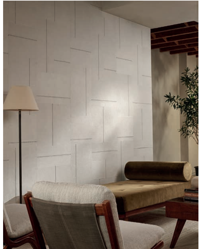
MERIDIAN | 4 Farben

Verschiedene Farben der Abacá-Garne kontrastieren auf subtile und zufällige Weise und erzeugen eine sanfte Bewegung in dieser schimmernden Grastapete