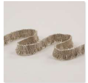
FRISSAGE Fringe 3 Couleurs