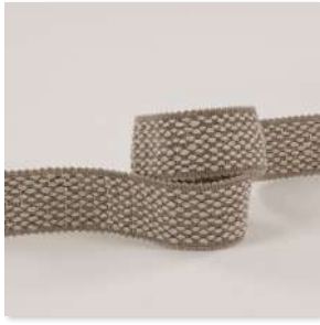
DECORER Braid 3 Couleurs