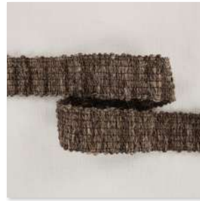
BORDURE Braid 7 Couleurs