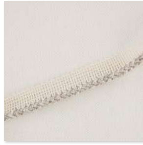
TRESSER Piping Cord 3 Couleurs