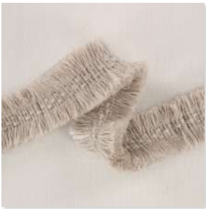
POMPONNER Double Edged Fringe 2 Couleurs