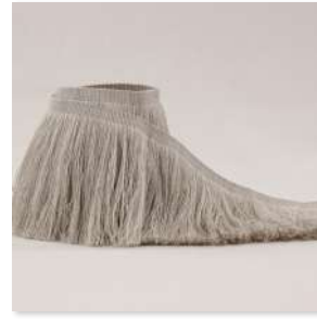
ELEGANTE Fringe 3 Couleurs