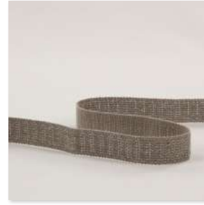
ORNER Braid 7 Couleurs