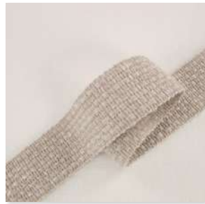
TISSAGE Braid 1 Couleur