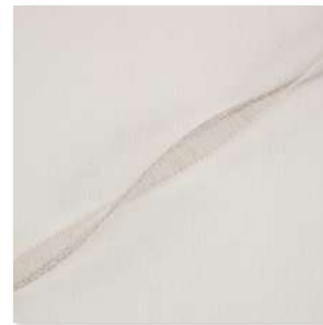
PETITE Cord 6 Couleurs