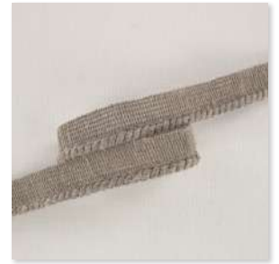
CORDE Cord 3 Couleurs