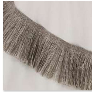
MARQUISE Fringe 2 Couleurs