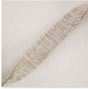
EMBELLIR Fringe 6 Couleurs