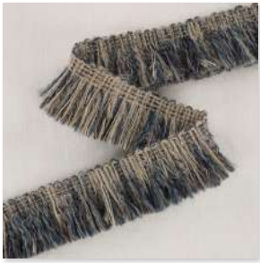
MELANGE Brush Fringe 7 Couleurs