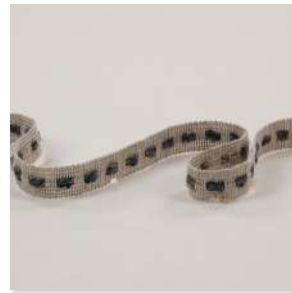
COUSU Braid 6 Couleurs