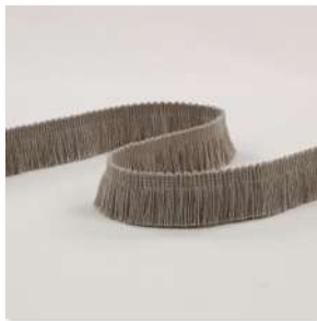
MAJESTE Brush Fringe 4 Couleurs