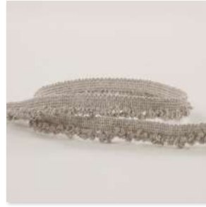
BOUCLE Fringe 4 Couleurs