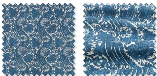
JAVA Lino estampado | 6 Colores 🚚 📏 📐