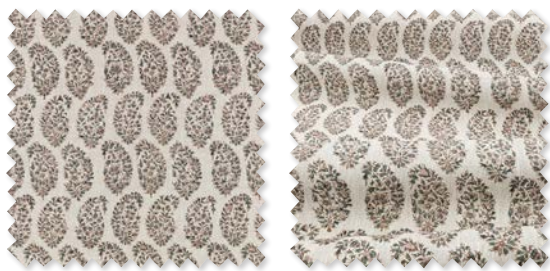
JAIPUR Lino estampado | 5 Colores 🚚 📏 📐

En esta oferta, el amor por el diseño de época es evidente, pero la mezcla de elementos es compleja, imaginativa y ricamente ecléctica.