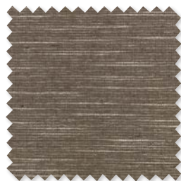
SOUK Tejido de lino 4 Colores