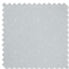
INDIENNE Visillo de lino bordado ◆ □