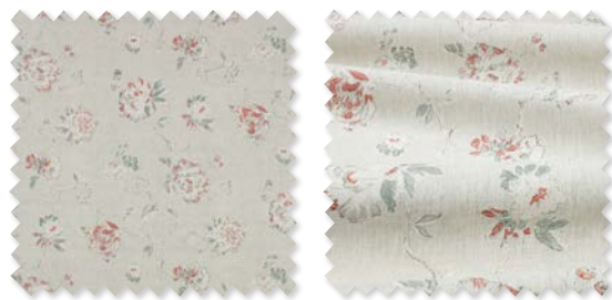
PEONY Lino estampado | 6 Colores 🚚 📏 📐