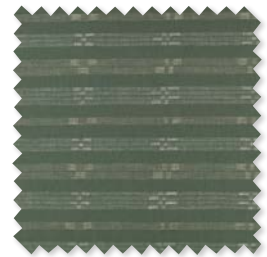
SHIMA Tejido de jacquard de lino 6 Colores