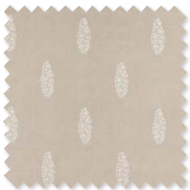
MUGHAL Lino bordado | 5 Colores ◆ □

Desde una tranquila reinterpretación de un diseño "crewel" tradicional hasta un diseño inspirado en un documento "paisley" del siglo XVIII, estos bordados encarnan el fino equilibrio entre tradición moderna y artesanía.