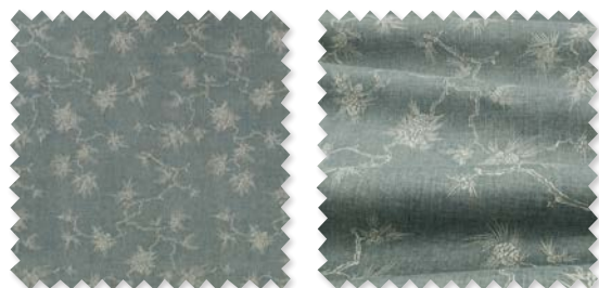
BONSAI Lino estampado | 6 Colores 🚚 📏 📐