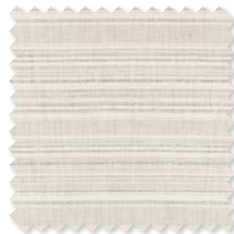
NOMAD Tejido de lino 6 Colores