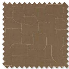
ATLAS Lino bordado | 5 Colores ◆ □