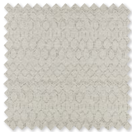
MAROC Tejido de jacquard de lino 2 Colores