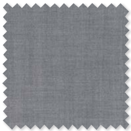
RIVA Tejido de jacquard de lino 4 Colores

Llenos de ricas texturas, estos discretos diseños están finamente elaborados pero son relajados, con cualidades naturales inherentes.