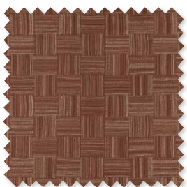
SANDTRACE Lino bordado | 4 Colores ◆ □