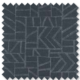
ODYSSEY Tejido de jacquard de lino 5 Colores