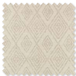
BERBER Tejido de jacquard de lino 5 Colores