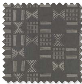
FOLK Lino bordado | 4 Colores ◆ □