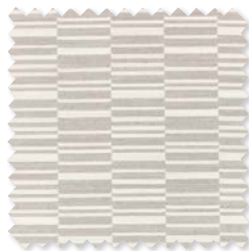
VERANDA OFFSET Tejido para interiores*/ exteriores 4 Colores 100% SD PC ☞ ⚡ 📏