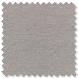
VERANDA BOUCLÉ Tejido para interiores*/ exteriores 7 Colores 100% SD PC ☞ ⚡ 📏

Veranda II amplía la gama de exterior de Mark Alexander con la introducción de nuevos hilos con carácter, como la chenilla y el bouclé.