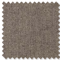
VERANDA PANAMA Tejido para interiores*/ exteriores 6 Colores 100% SD PC ☞ ⚡ 📏