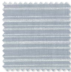
VERANDA HORIZON Tejido para interiores*/ exteriores 4 Colores 100% SD PC ☞ ⚡ 📏