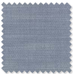
VERANDA DIAMOND Tejido para interiores*/ exteriores 4 Colores 100% SD PC ☞ ⚡ 📏