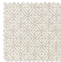
VERANDA TILE Tejido para interiores*/ exteriores 3 Colores 100% SD PC ☞ ⚡ 📏