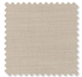
VERANDA CANVAS Tejido para interiores*/ exteriores 5 Colores 100% SD PC ☞ ⚡ 📏