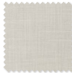
VERANDA SOFT Tejido para interiores*/ exteriores 8 Colores 100% SD PC ☞ ⚡ 📏