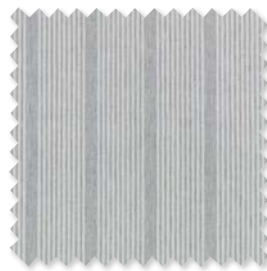
HARPER STRIPE Velato per Interni/Esterni 3 Colori | 100% SD PC