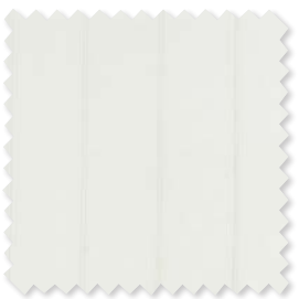
WATERLINE Velato per Interni/Esterni 5 Colori | 100% SD PC