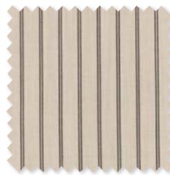
VERANDA DECK STRIPE Indoor/Outdoor Gewebe 4 Farben 100% SD PC ☞ ⚡ 📏