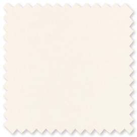
HAVEN Indoor/Outdoor Transparent 7 Farben | 100% SD PC

Veranda Sheers kombiniert die hohe Leistungsfähigkeit von spindüsengefärbtem Acryl mit einer einzigartigen natürlichen Weichheit. Diese Textilien wurden für den Einsatz in Bereichen mit starker Sonneneinstrahlung entwickelt, sind lichtbeständig, pflegeleicht und sind doppelt-breit für eine nahtlose Montage.