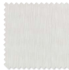
HITHE Indoor/Outdoor Halbtransparent 2 Farben | 92% SD PC, 8% PL