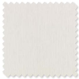
DRIFT Indoor/Outdoor Transparent 5 Farben | 100% SD PC