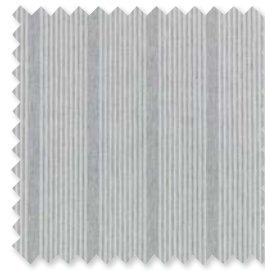
HARPER STRIPE Indoor/Outdoor Transparent 3 Farben | 100% SD PC