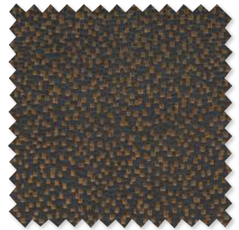
Khiva Velours jacquard 6 Couleurs