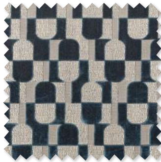
Arkose Velours jacquard 4 Couleurs