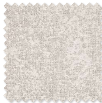
Valante Chenille texturée 2 Couleurs