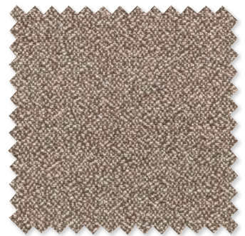
Arno Tissage texturé 3 Couleurs