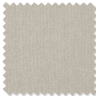
Belisto Tissage bouclé 2 Couleurs