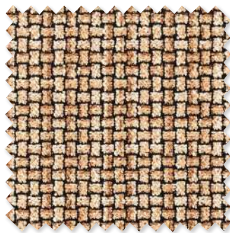
Ruban Tissage décoratif 4 Couleurs