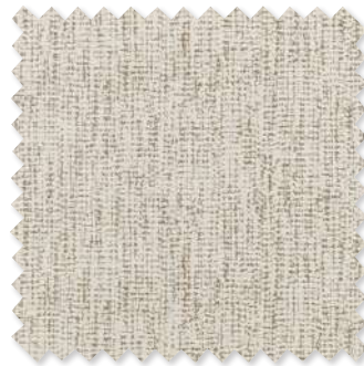
Tarni Chenille texturée 2 Couleurs