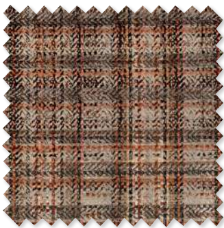
Zurana Velours jacquard imprimé 3 Couleurs

La collection Arkose dévoile une tapisserie de texture, ou des velours à la fois sophistiqués et ludiques, s'enlacent gracieusement avec des fils scintillants. Des tissages texturés avec des fils riches et tactiles et des touches de chenilles fournissent de l'opulence élégante, créant une expérience tactile qui est simplement inégalée. Assurant un impact visuel inoubliable, Arkose enchante avec une riche intonation de couleur, ainsi qu'un spectre de neutres et de tons terreux profonds.