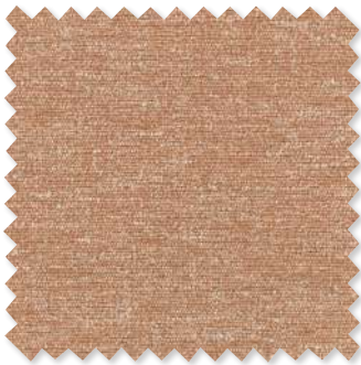
Lori Tissage texturé 5 Couleurs