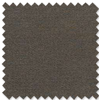
Benetti Tissage texturé 2 Couleurs