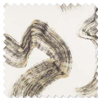
Tsauri Gilt Jacquard Gewebe 2 Farben