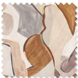
Figura Bedrucktes Leinen 3 Farben