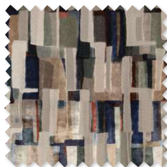
Quadrata Jacquard-Velours 3 Farben