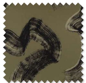
Tsauri Jacquard Gewebe 6 Farben