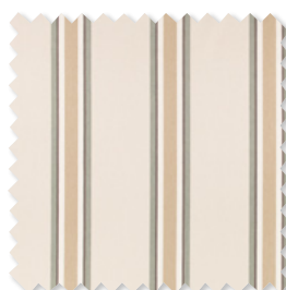
Elson Mezcla de algodón a rayas 5 Colores