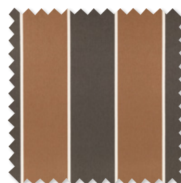
Arbury Mezcla de algodón a rayas 6 Colores