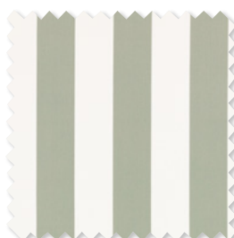
Aron Algodón a rayas 9 Colores