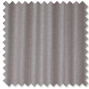
Inessa Semi-Visillo de Doble Ancho 5 Colores