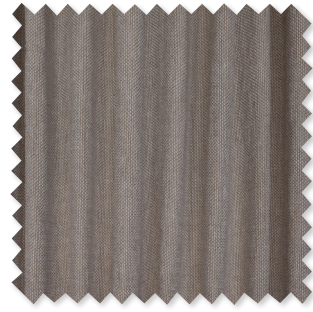
Naro Semi-Visillo de Doble Ancho 5 Colores