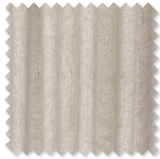
Cicely Mezcla de lino jacquard de doble ancho 3 Colores