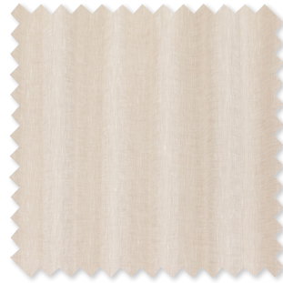
Iseo 100% Leinen Transparent 4 Farben