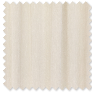
Nimbus Doppelt-breiter Transparent 3 Farben