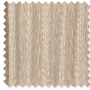
Naro Doppelt-breiter Halbtransparent 5 Farben