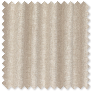
Inessa Doppelt-breiter Halbtransparent 5 Farben