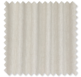
Ora Doppelt-breiter Transparent 4 Farben