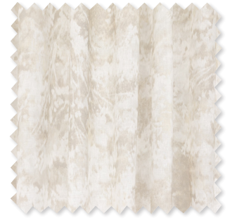
Sikora Sheer bedruckter Transparent 2 Farben