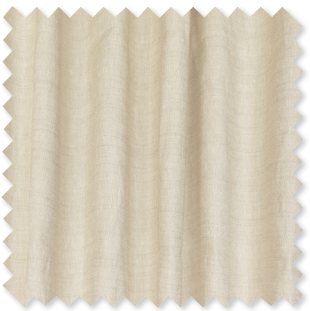
Emi Doppelt-breiter Halbtransparent 4 Farben