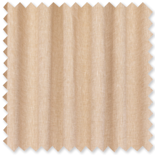
Escuro Doppelt-breiter Transparent 5 Farben