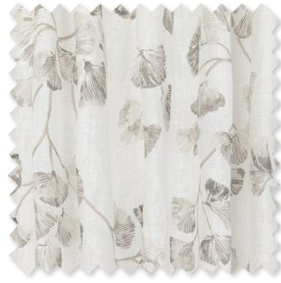
Kiana 100% auf Leinen gedruckter Transparent 1 Farbe