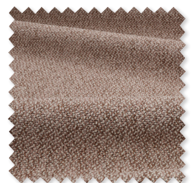
Aikana tessuto bouclé testurizzato 6 Colori