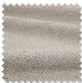
Zolani tessuto testurizzato 5 Colori