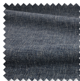
Sula tessuto falso-unito 11 Colori