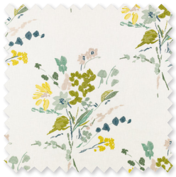
A bloom | 5 Farben Stickerei