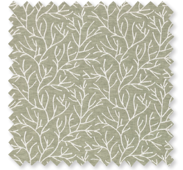
Cerelia | 5 Farben Stickerei