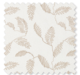
Folia | 5 Farben Embroidered Sheer