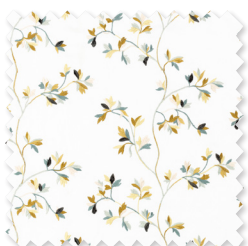
Aurea | 5 Farben Bestickter Leinen Mix