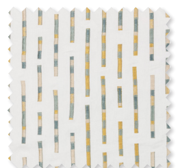
Elwood | 5 Farben Bestickter doppelt- breiter Transparent