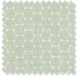
Enso | 4 Farben Bestickter Leinen Mix