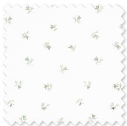
Fiora | 4 Farben Bestickter doppelt- breiter Transparent