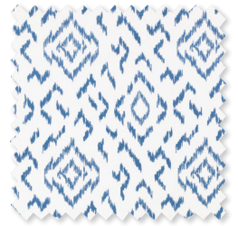
Folly | 4 Farben Stickerei