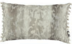
Laru Granite VNC3534/02 50cm x 30cm / 19.75" x 11.75"