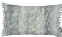
Laru Agate VNC3534/03 50cm x 30cm / 19.75" x 11.75"