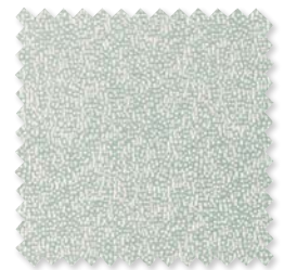
Tottori | 6 Colores Tejido Jacquard ◆ □