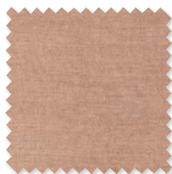
Goldstone | 9 Colores Semi-visillo doble ancho