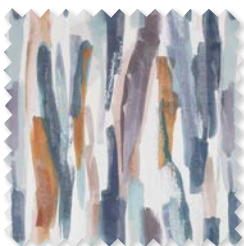
Danxia | 4 Colores Tejido Jacquard Estampado de doble ancho. ◆ □