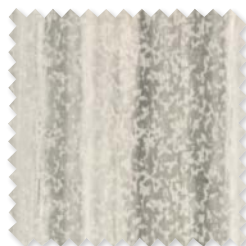
Laru | 3 Colores Tejido Jacquard de doble ancho ◆ □