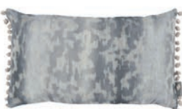
Laru Thunder VNC3534/01 50cm x 30cm / 19.75" x 11.75"