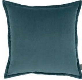
Rio Rain VNC3539/37 55cm x 55cm / 21.75" x 21.75"