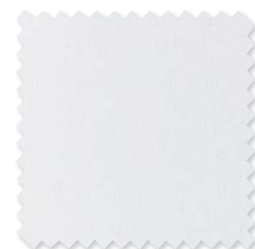
Mica | 2 Colores Visillo doble ancho