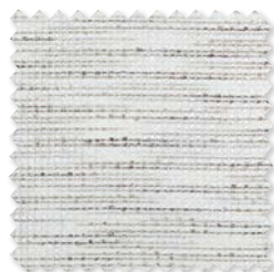
Caldera | 3 Colores Aluminio estampado Tejido Jacquard ◆ □