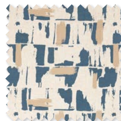
Lydia | 5 Colores Aluminio estampado ◆ □