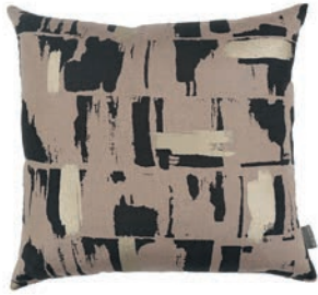
Lydia Lotus VNC3541/01 50cm x 50cm / 19.75" x 19.75"