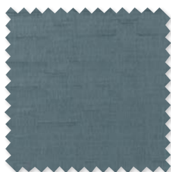
Basalt | 5 Colores Semi-visillo doble ancho