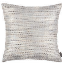
Caldera Pearl VNC3533/02 50cm x 50cm / 19.75" x 19.75"