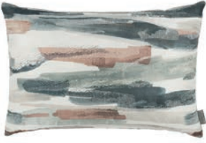
Danxia Lotus VNC3531/04 60cm x 40cm / 23.5" x 15.75"