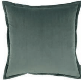
Rio Agave VNC3539/45 55cm x 55cm / 21.75" x 21.75"