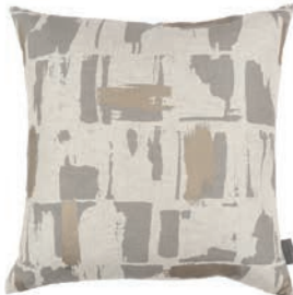
Lydia Pearl VNC3541/03 50cm x 50cm / 19.75" x 19.75"