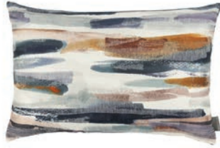
Danxia Sundown VNC3531/01 60cm x 40cm / 23.5" x 15.75"