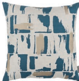
Lydia Indigo VNC3541/04 50cm x 50cm / 19.75" x 19.75"