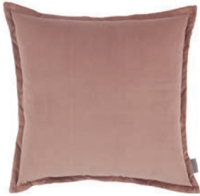
Rio Lotus VNC3539/31 55cm x 55cm / 21.75" x 21.75"