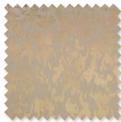
Galena | 5 Colores Tejido Jacquard ◆ □