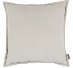
Rio Seal VNC3539/10 55cm x 55cm / 21.75" x 21.75"