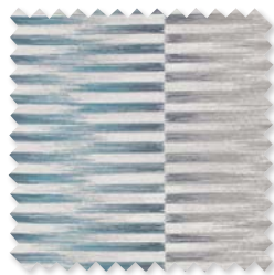
Mesa | 3 Colores Tejido Jacquard ◆ □