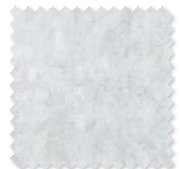
Tanah | 2 Colores Tejido Jacquard estampado ◆ □