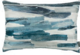
Danxia Indigo VNC3531/02 60cm x 40cm / 23.5" x 15.75"