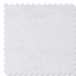
Quartzite | 6 Colores Visillo doble ancho