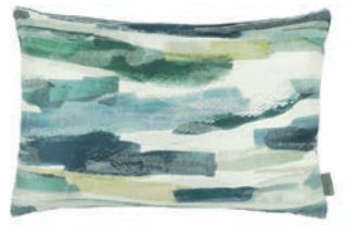
Danxia Emerald VNC3531/03 60cm x 40cm / 23.5" x 15.75"