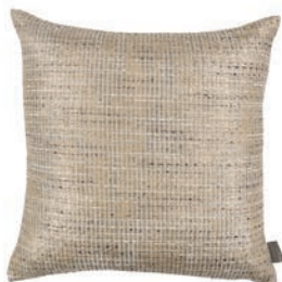
Caldera Marble VNC3533/03 50cm x 50cm / 19.75" x 19.75"