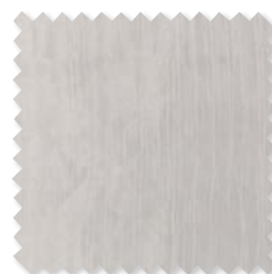
Keshi | 5 Colores Visillo doble ancho