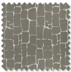
Roca | 7 Colores Tejido Jacquard Satinado ◆ □