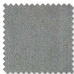
Atlan | 6 Colores Visillo doble ancho