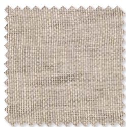
Morro | 4 Colores Visillo doble ancho