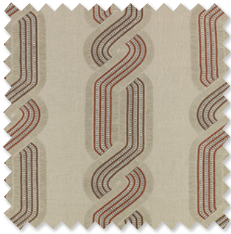
ludo Broderie 2 Couleurs ☞ ⬅️ ⬆️ ⬇️