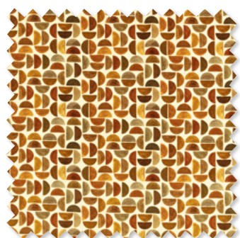
par Velours en Coton Imprimé 2 Couleurs ☞ ⬅️ ⬆️ ⬇️