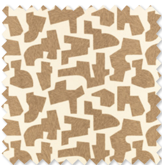
jigsaw Coton Brodé 3 Couleurs ☞ ⬅️ ⬆️ ⬇️