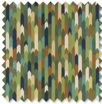
arraz Tissage Tapisserie Jacquard 3 Couleurs ☞ ⬅️