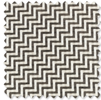
ladder Chevron Weave 4 couleurs ☞ ⬅️ ⬆️ ⬇️