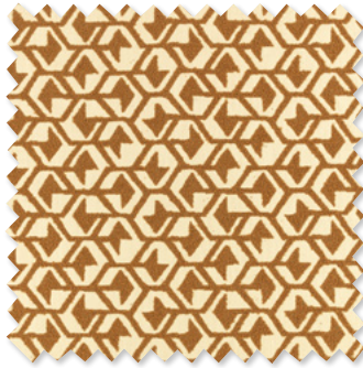
hex Tissage de Poche Bouclée 4 Couleurs ☞ ⬅️