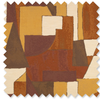
cubilette Tissage Tapisserie Jacquard 2 Couleurs ☞ ⬅️ ⬆️ ⬇️