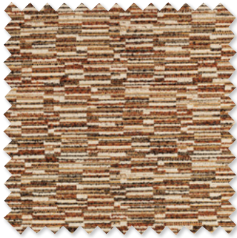
jenga Bouclé 5 Couleurs ☞ ⬅️ ⬆️ ⬇️