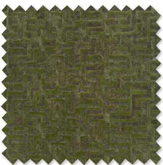
labyrinth Velours de Coton Brodé 4 Couleurs ☞ ⬅️