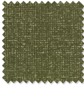
barbudi Felpilla 4 Colores 🚗🔍