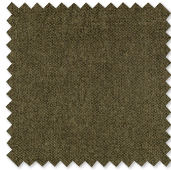
draughts Felpilla Lavable 7 colores 🚗🔍