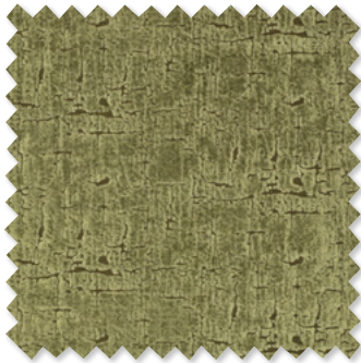
ellice Terciopelo de Mezcla de Lino 8 Colores 🚗🔍