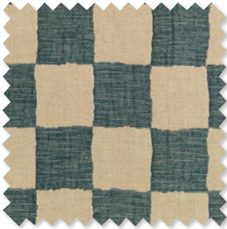
checkmate Taschengewebe 7 Farben