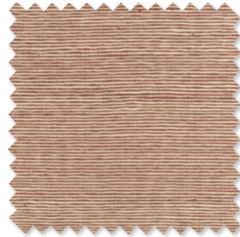
solitaire Ottoman 7 Farben