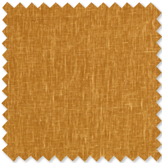
lasca 100% Uni-Leinen 7 Farben